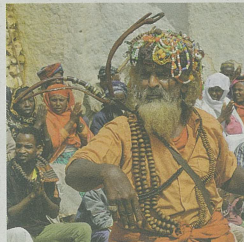
Lors du pèlerinage de Cheikh Hussein. JEAN MARGELISCH

Caves de Courten, jusqu'au 2 août. Du ma au di, de 15 à 18 heures.