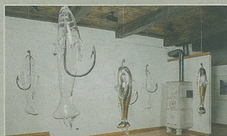
Joëlle Allet, Aquarium, glas, 2014.